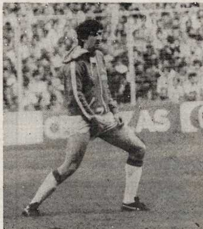
CLARKE fue el verdugo rojiblanco. Marcó ayer dos de los goles del Ajax.

Por otro lado, Brom declaró: «No me ha parecido mal el Athletic. Sencillamente que fuimos muy superiores a ellos en todo. Hubiera sido una injusticia quedar apeados de la Copa de la UEFA por el resultado absurdo de San Mamés. Yo ya dije que tenía plena confianza en seguir adelante y así ha sido».