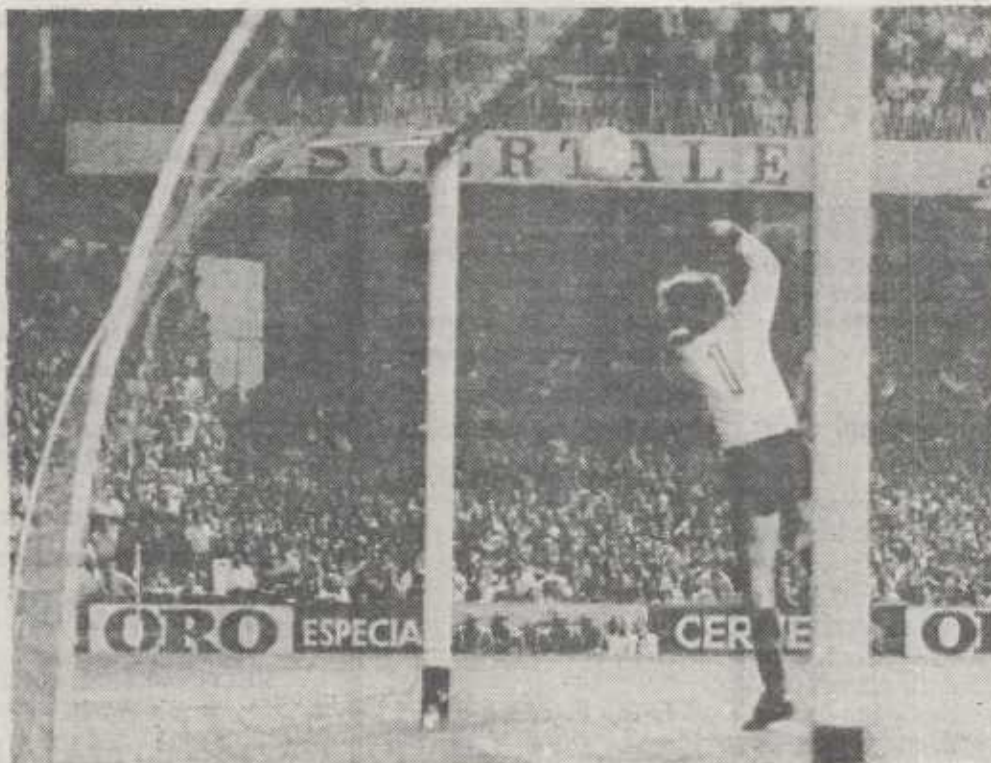
Tercer gol rojiblanco. Dani fue el encargado de materializarlo. Como involuntario colaborador el meta húngaro que, después de interceptar el balón, permitió que se introdujera en sus redes. (Foto BEATRIZ).