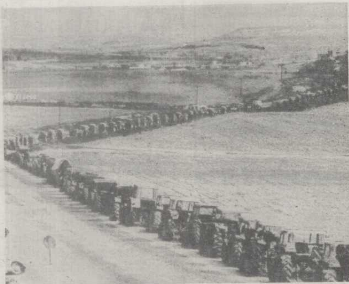
En la fotografía tomada en la carretera N-232, cerca de la capital riojana, en el término del pantano de «La Grajera», se puede apreciar la interminable fila de tractores situados al borde de la carretera.

★ Representantes de los agricultores piden audiencia al presidente Suárez