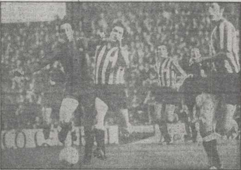
Fue el gran duelo de la noche. Cruyff-Villar o Villar-Cruyff, que también tuvo que defender lo suyo el holandés, pese a que se pasara casi una hora de partido sentado en su poltrona, junto a la banda izquierda de su equipo. Luego despertaría y con él renació algo este pobre Barcelona, que ayer volvió a evidenciar su mal momento actual. Puede decirse que fue éste de Villar y Cruyff un duelo sin vencedor ni vencido, porque cada cual cumplió, al final, con su obligación.