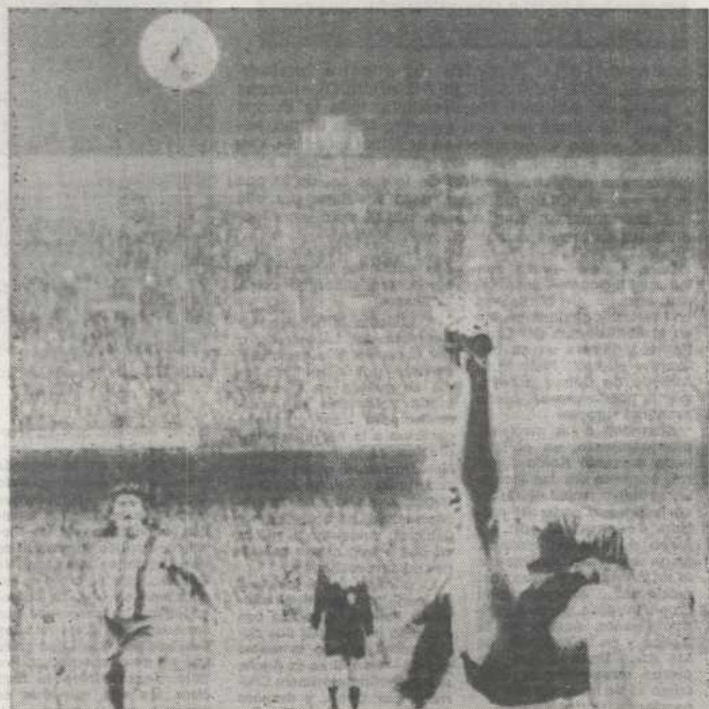
Los búlgaros, a pesar de que vencieron por la mínima en el partido de ida, no pudieron conseguir que los «colchoneros» perforaran su puerta por dos veces. En la telefoto de C.F.R.A., un espectacular despeje de la defensa búlgara.

Pereira puso orden en la defensa atlética y con Robi, y el coraje de Ayala fueron lo