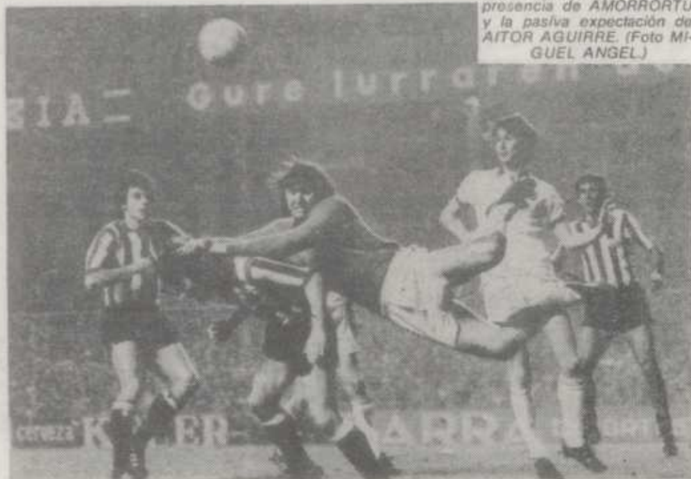
hacer un gol pronto. Eso hubiera serenado nuestro

-Hombre, quizá influyó que no fuéramos capaces de