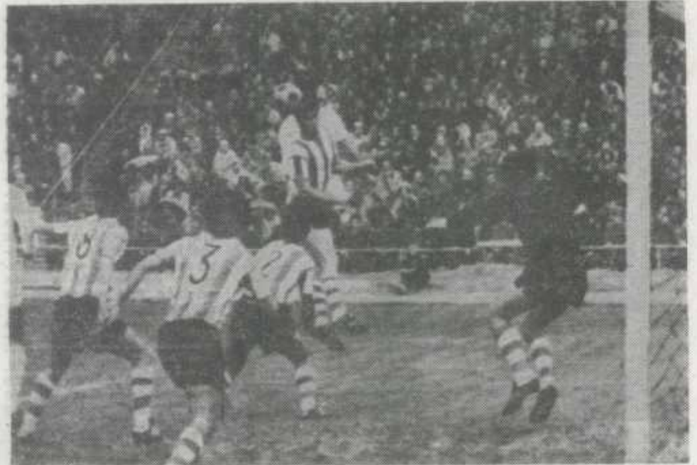
En la fotografía, uno de los múltiples acosos de la delantera del equipo búlgaro Stara Zagora ante la portería de Iribar, en el partido celebrado ayer en Bulgaria, perteneciente a la Copa de Europa de campeones de Copa, y en el que el Athletic fue derrotado por tres goles a cero.

La expulsión de Zubiaga (minuto 59) dificultó más la reacción de los bilbaínos