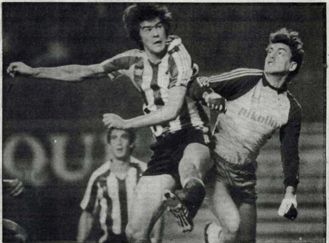
El B. Athlétic atacó sin orden y sin ideas. Su eliminación es justa.

Perdió, en San Mamés, con el Aragón (0-1)