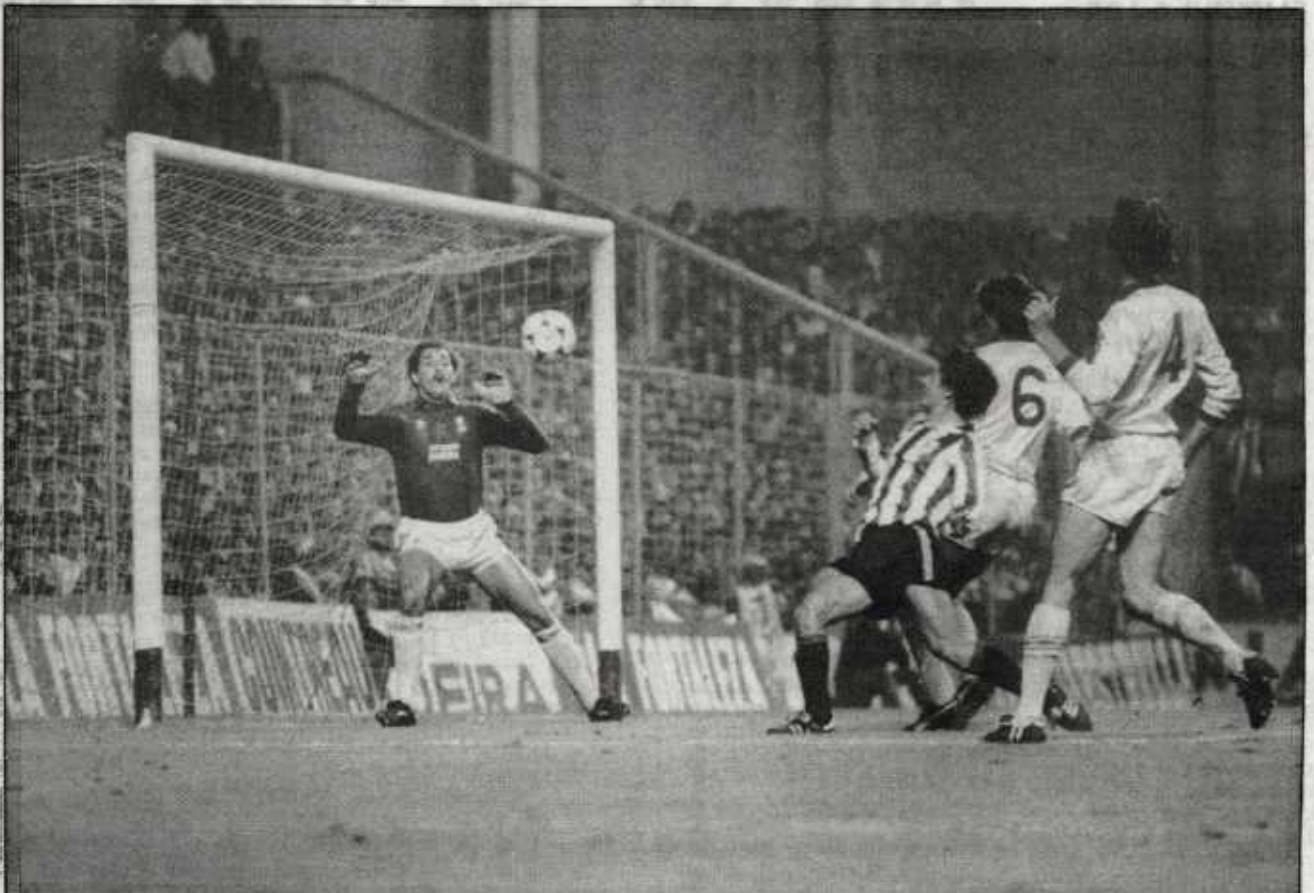
Era el minuto uno y a Noriega se le fue alto este remate.

Los rojiblancos, sin personalidad y con miedo, cedieron demasiado ante el Liverpool