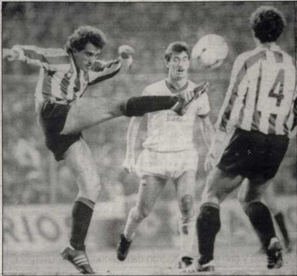
Goikoetxea y Liceranzu, al final, no pudieron impedir que marcara Rush.