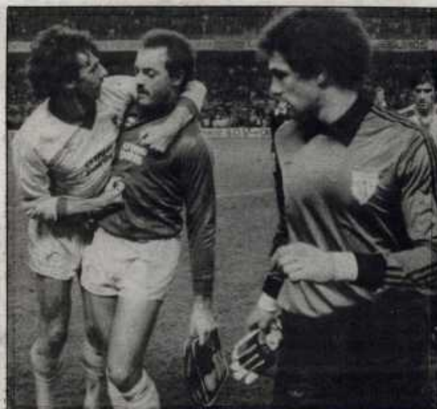
Alegria inglesa y desolación vasca.

«Han sido muy correctos y en muchos momentos sus voces, aunque hayan sido para animar a su equipo, nos han dado fuerza en el campo, porque nosotros ya estamos acostumbrados a jugar con mucho griterío».