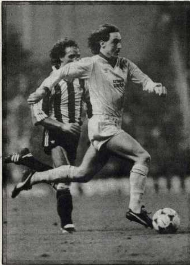
Impecable estilo del goleador inglés, Rush.