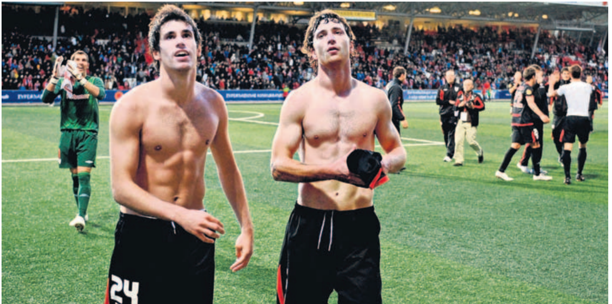
AGRADECIMIENTO. Los jugadores lanzaron su camisetas al público tras la conclusión del encuentro.

Athletic A la siguiente fase, con más pena que gloria