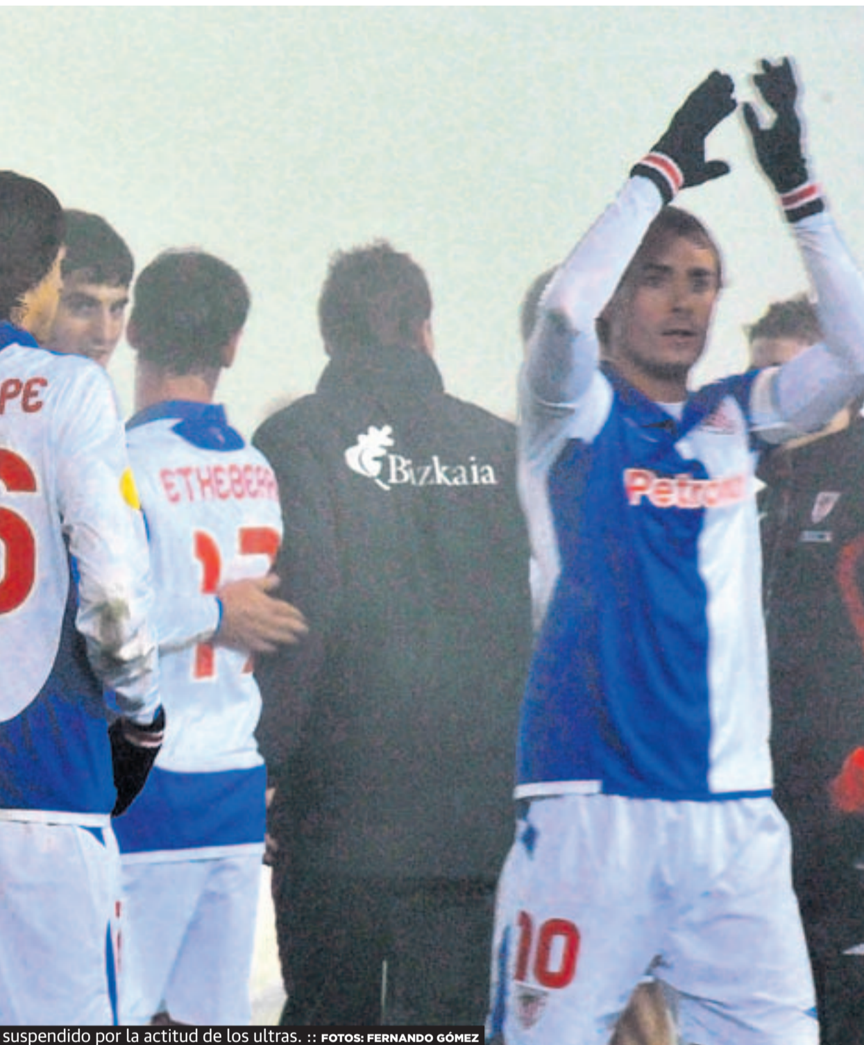
suspendido por la actitud de los ultras.

que abarca a todos sus integrantes. Es una cuestión que no tiene que ver estrictamente con el juego. Es una cuestión moral. Hay buen rollo, dinamismo y ambición. Esta energía positiva la sienten, a estas alturas, todos los jugadores, incluidos los que han interpretado un papel menos grato hasta la fecha.