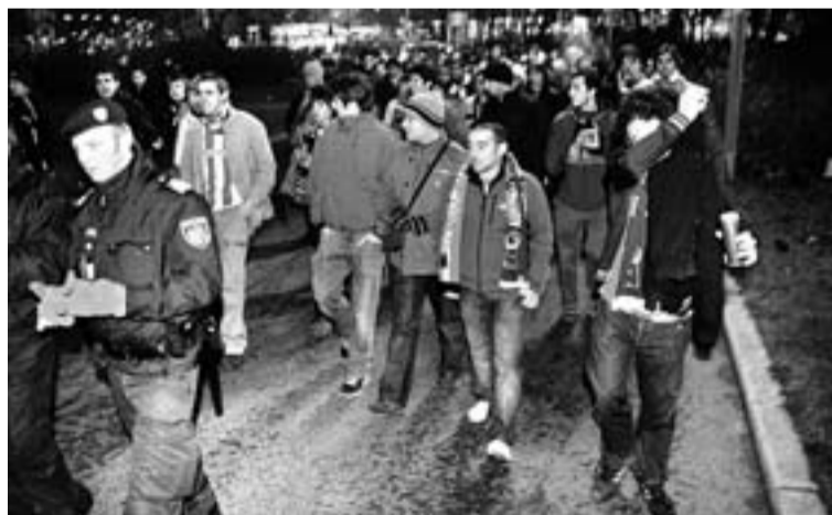
Aficionados del Athletic llegan escoltados al estadio.

El Athletic estaba alerta tras ver el comportamiento en el partido de San Mamés de los neonazis. Por eso, pidió a la Ertzaintza que enviara a agentes de paisano para proteger a sus seguidores. Los ertzainas ayudaron a la Policía austríaca a escoltar a los hinchas bilbaínos desde el centro de la ciudad hasta el estadio. Al final del choque, sin embargo, cuando se dirigían a los autobuses sufrieron el lanzamiento de latas de cerveza y una mujer resultó herida leve.