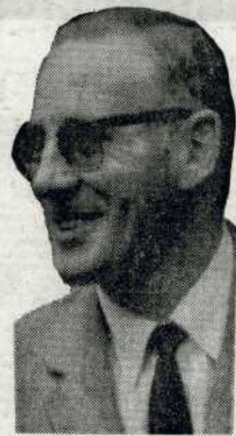
Por nuestro enviado especial JOSE RAMON BASTERRA